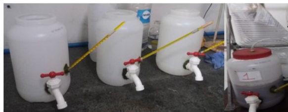
Figura 1: Prototipos de biodigestor vacíos (izquierda). Prototipo de biodigestor cargado y cerrado herméticamente (derecha)

La medida de carbono total se realizó mediante titulometría y la de humedad por la técnica de gravimetría. El calcio, magnesio, zinc y potasio fueron determinados según norma la COVENIN [5], la concentración de los cationes en los sobrenadantes fue cuantificada en un espectrofotómetro Perkin-Elmer modelo 3100 y el porcentaje de fósforo total usando digestión ácida [7].